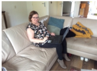
Ervaringsverhaal: Grip op leven met digitaal dossier