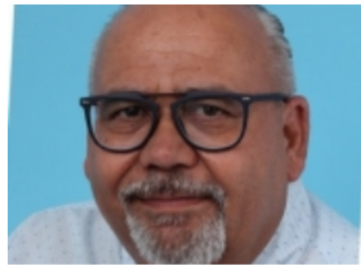
Ervaringsverhaal: Compleet beeld van medische toestand in één dossier