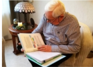
Ervaringsverhaal: Inzicht in gezondheidstoestand werkt motiverend